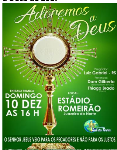
Figura 3: Cartaz do evento Adoremos a Deus de 2017