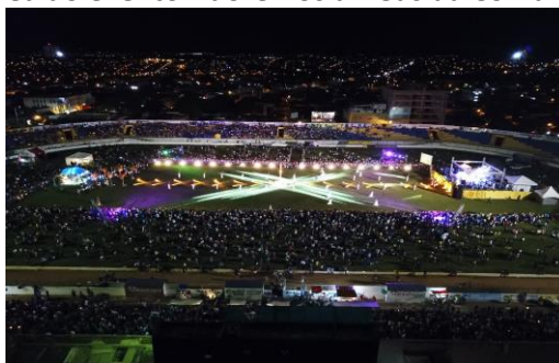
Figura 1: Vista aérea do evento Adoremos a Deus da Comunidade Sal da Terra