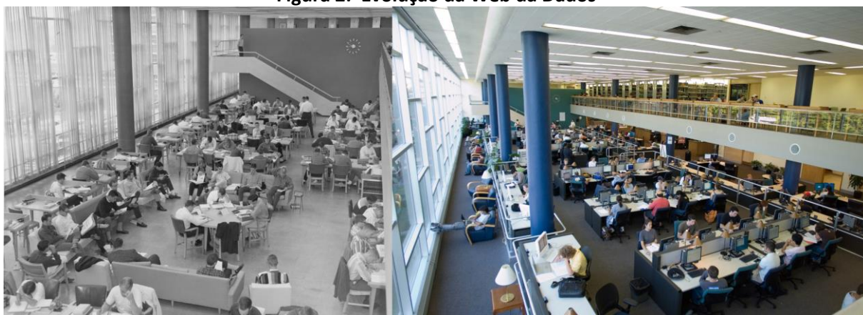
Figura 2: Evolução da Web da Dados