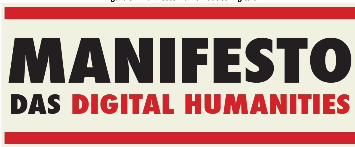
Figura 3: Manifesto Humanidades Digitais

Fonte: Poster Português - Tradução de Hervé Théry – Enviado para o HD.br por Marie Pellen Poster confeccionado pela equipe hypotheses.org THATCamp : Paris, 18 e 19 de maio de 2010 https://humanidadesdigitais.org/manifesto-das-humanidades-digitais Fonte_Créditos: https://humanidadesdigitais.org/ Fonte: https://humanidadesdigitais.files.wordpress.com/2011/10/poster_manifesto_hd_portugues.pdf Publicado originalmente no THATCamp 2012