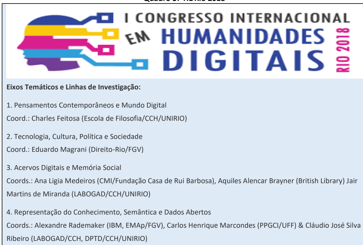
Quadro 3: HDRio 2018

No Brasil iniciativas no campo das Humanidades Digitais ainda são embrionárias e destacamos a realização do I Congresso Internacional em Humanidades Digitais – HDRio2018, Figura 4. Um passo importante para estabelecer o diálogo entre pesquisadores, especialistas e profissionais neste campo emergente e transdisciplinar.