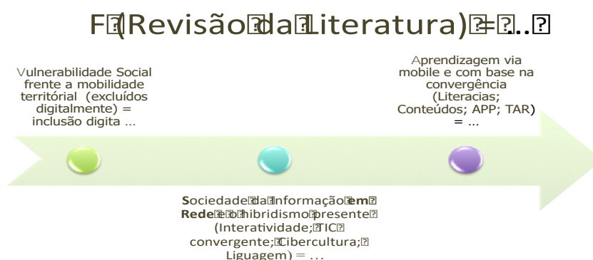
Figura 1: A função Revisão da Literatura